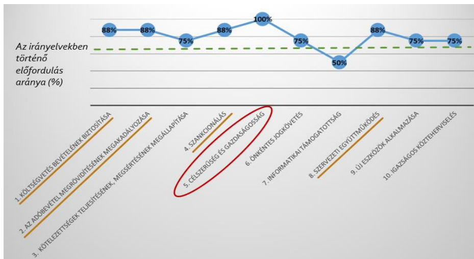
Diagram 3: Proportion of specific targets in guidelines